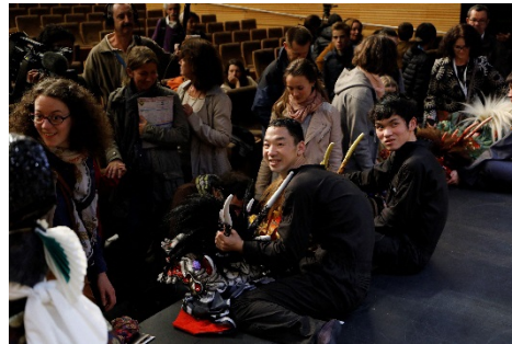
「2017ジャパン×ナントプロジェクト」上演後にナント市民との交流